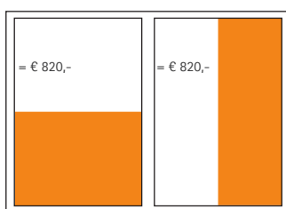
1/2 Seite, quer 175 x 125 mm 1/2 Seite, hoch 85 x 255 mm