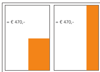
1/4 Seite, Ecke 85 x 125 mm 1/4 Seite, hoch 40 x 255 mm

Alle Preise verstehen sich vollfarbig, 4c Euroskala. Bei Fragen zu Sonderwerbeformen oder zu den vielfältigen Platzierungsmöglichkeiten wenden Sie sich bitte an den Ansprechpartner (siehe Seite 2).