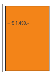
1/1 Seite 175 x 255 mm