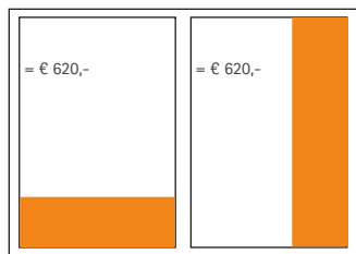
1/3 Seite, quer 175 x 82 mm 1/3 Seite, hoch 55 x 255 mm

Alle Preise verstehen sich vollfarbig, 4c Euroskala. Bei Fragen zu Sonderwerbeformen oder zu den vielfältigen Platzierungsmöglichkeiten wenden Sie sich bitte an den Ansprechpartner (siehe Seite 2).